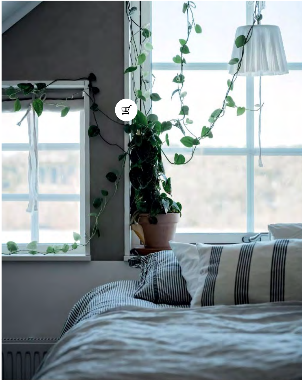
Vårt nya hus