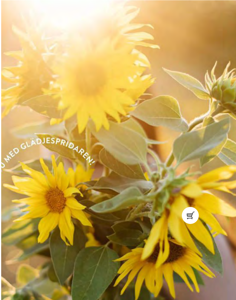
Leva och Bo